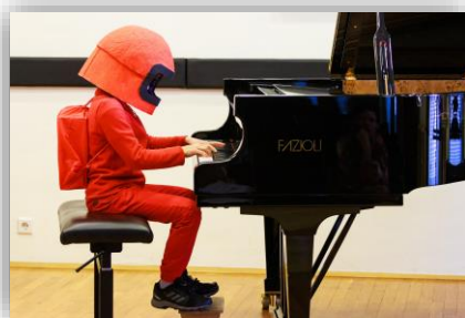
Pustni nastop (februar 2023)