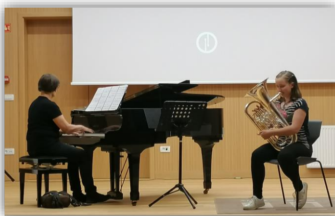
Tekmovanje Bolero 2023

Vseh tekmovalcev je bilo 37 (8 v sklopu komorne skupine), pri čemer je sodelovalo 22 učiteljev in 8 korepetitorjev, zabeležili pa smo 46 tekmovalnih nastopov naših učencev. Učenci so prejeli 26 zlatih priznanj, 17 srebrnih priznanj in 3 bronasta priznanja. Na tekmovanju TEMSIG prvič ni bilo predvidenega predtekmovanja temveč so vsi tekmovalci nastopali na državnem nivoju.