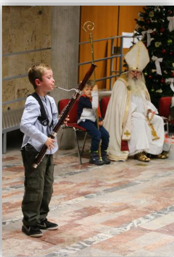
Miklavžev večer (december 2022)