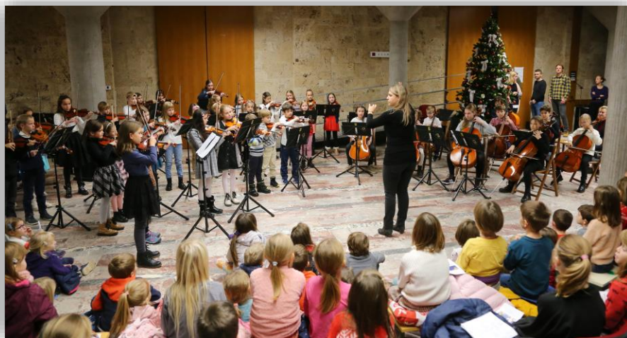
Miklavžev večer (december 2022)

Učence in starše GŠ Kranj bomo spodbujali tudi k udeležbi drugih zanimivih koncertov v organizaciji drugih, za katere se nam bo udeležba zdela smiselna in primerna za učence. Vabila k udeležbi bodo prejeli starši po e-pošti.