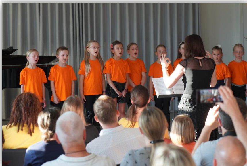
Koncert pevskih zborov (maj 2023)