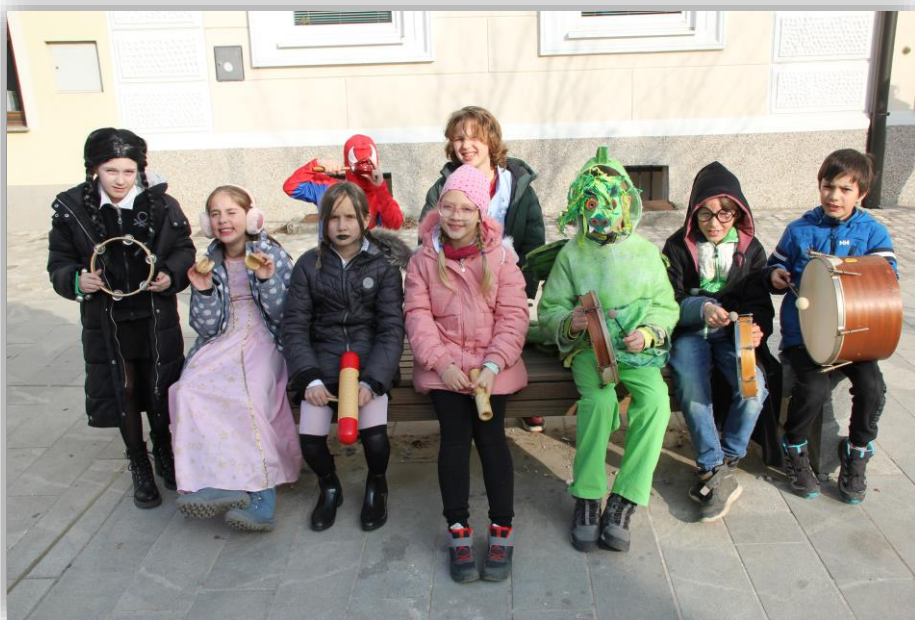
Pustni potep po mestu (februar 2023)