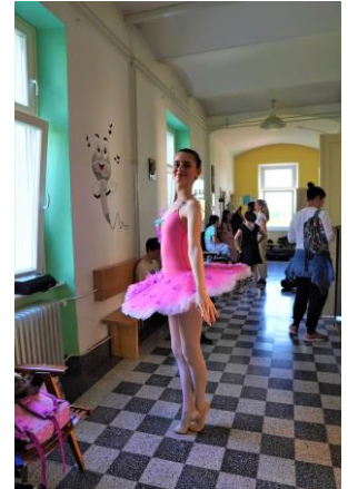
Dan odprtih vrat ( maj 2023)