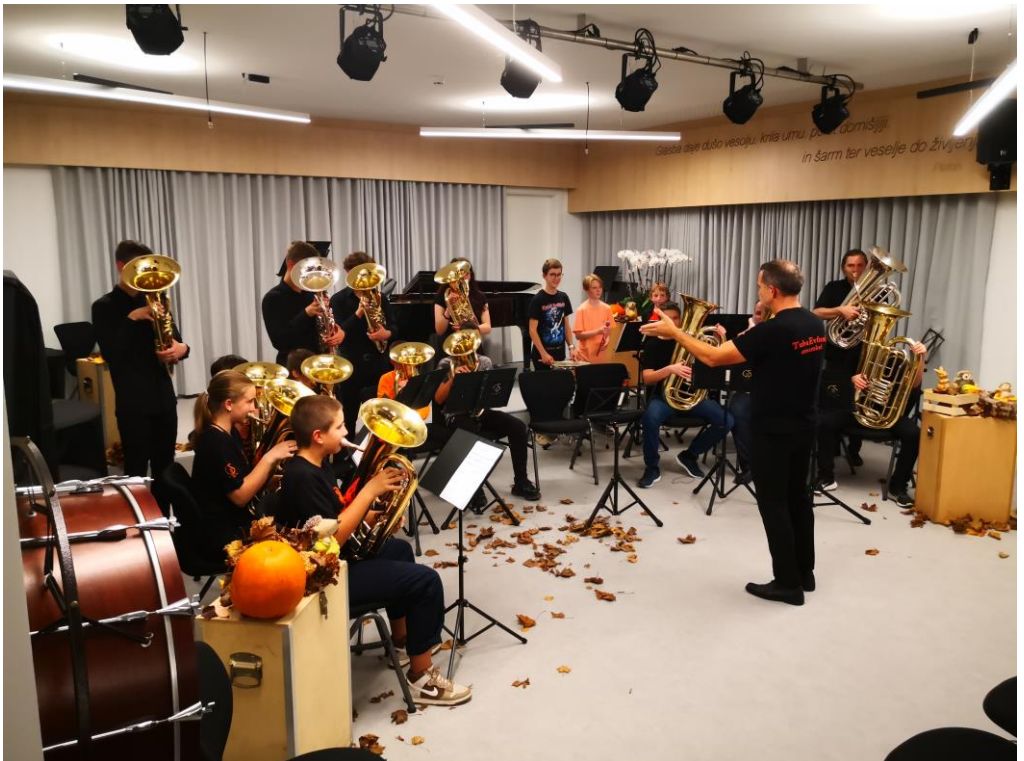
Oktubafest (oktober 2022)