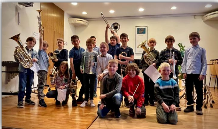
Nastop učencev 1. razreda trobil in tolkal 2023