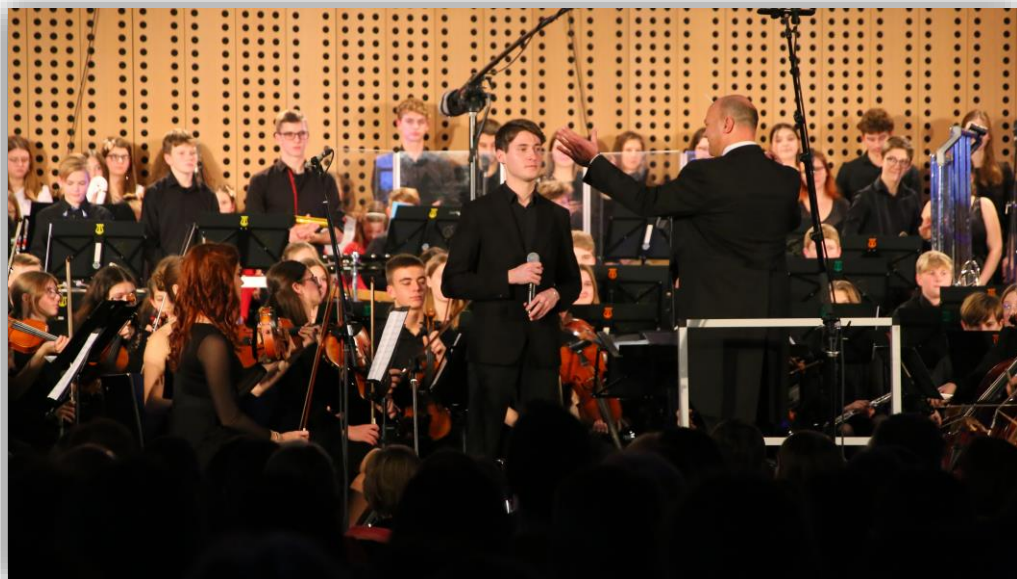
Božično novoletni koncert orkestrov in pevskega zbora (december 2022)