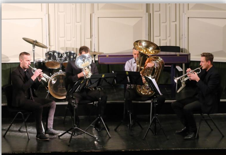
Koncert učiteljev – trobilni kvartet (november 2022)