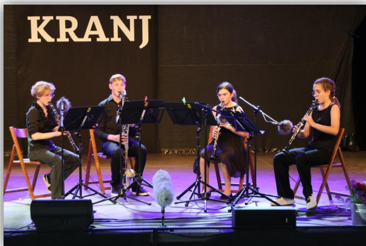
Zaključni slavnostni koncert (junij 2023)