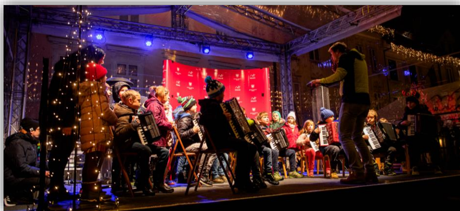
Nastop za Miklavža na Glavnem trgu v Kranju (december 2022)