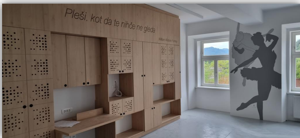
Baletna dvorana na Cankarjevi ulici 2

Ustanoviteljica Glasbene šole Kranj je Mestna občina Kranj. Poleg učencev iz kranjske občine pa šolski okoliš sestavljajo še učenci iz občin Cerklje na Gorenjskem, Naklo, Preddvor in Šenčur.